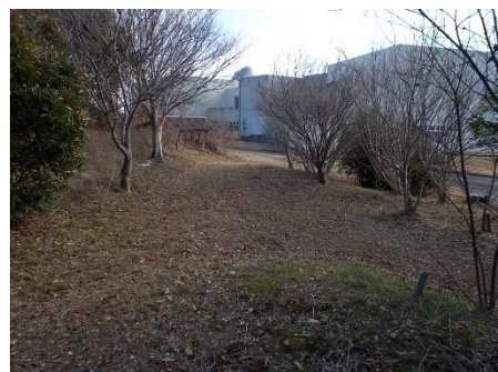
屋外にある自然観察園